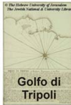
Golfo di Tripoli