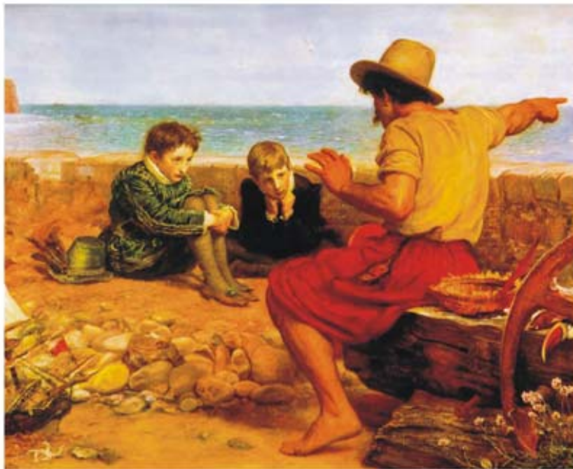
Le avventure di un lupo di mare