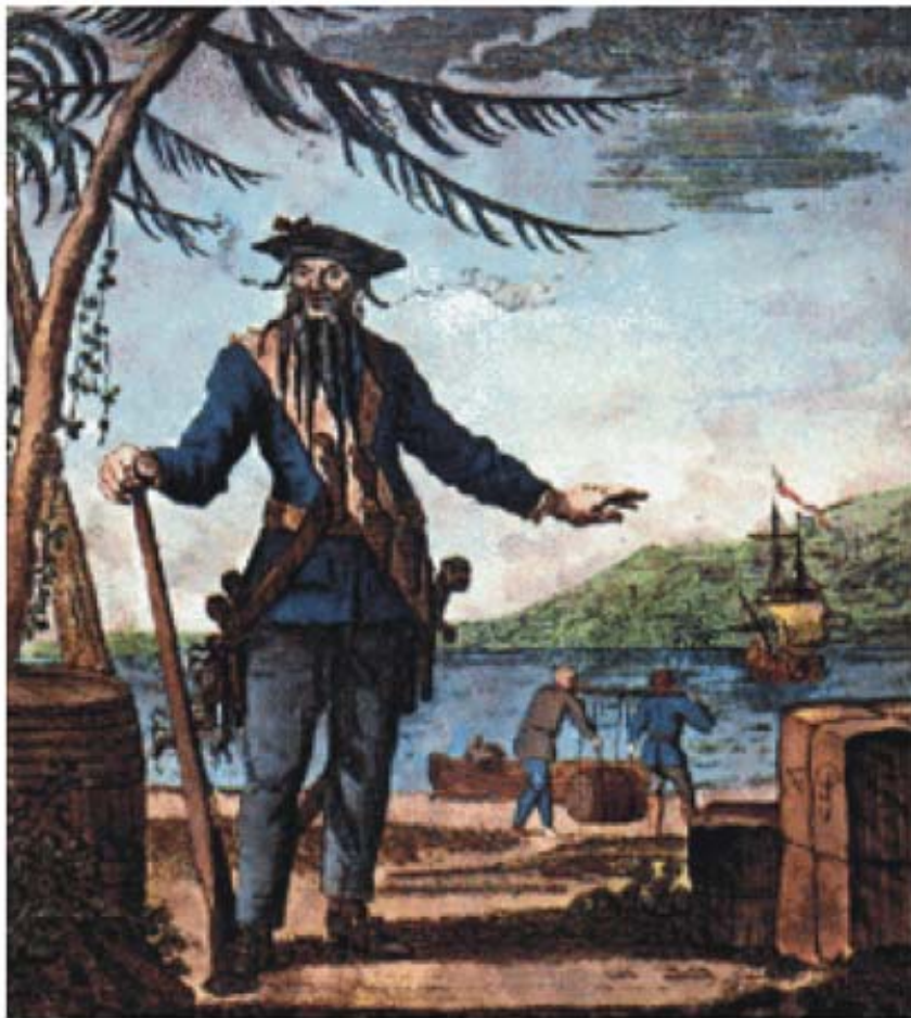
Barbanera il terribile