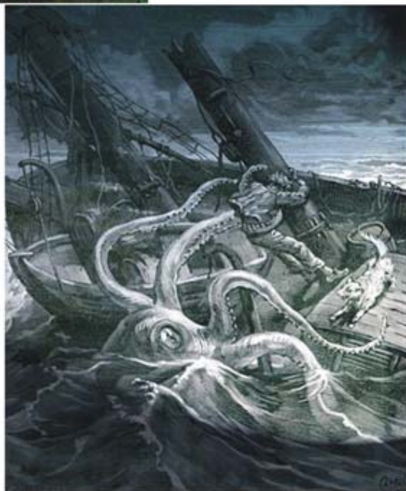
Il kraken: La piovra gigante che poteva trascinare sul fondo le navi

Cosa non si doveva mai fare di venerdì o di martedì? I marinai, pirati compresi, ritenevano che questi fossero giorni sfortunati. Quindi durante queste giornate non si doveva dare il via a nessuna azione; non si poteva salpare, partire per una missione, non si poteva iniziare nulla di importante. E' noto che le donne non erano ammesse a bordo, in particolare, delle navi pirata. L'origine di tutto questo si fa in genere risalire alla convinzione che le donne potevano essere delle streghe, specialmente. Il diavolo in persona o le streghe infatti potevano scatenare le terribili tempeste tropicali. Ma piuttosto il motivo del rifiuto di donne a bordo era di ordine pratico. Le donne potevano non solo distrarre i marinai dal loro dovere ma anche generare risse, pur non intenzionalmente. Altre persone sgradite a bordo erano i preti. Il demonio invidia gli uomini ai quali Dio ha concesso l'uso del mare e contro di loro scatena le tempeste. Un prete a bordo è una sfida contro il diavolo e comporta un più alto rischio di colare a picco. Il Giona poi, era quel marinaio che, portando sfortuna, poteva mettere a rischio la vita di tutti gli altri. L'unico modo per liberarsi della cattiva sorte era liberarsi di lui, alla lettera. Quando veniva individuato l'attira sfortuna, lo si buttava in mare, facendogli fare il cosiddetto "salto di Giona".